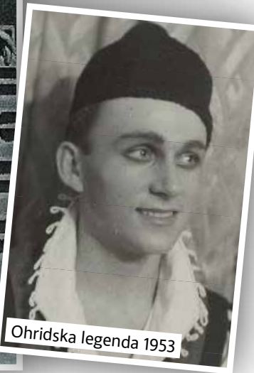
Ohridska legenda 1953

ter je bil takrat pravi teater. Dišalo je po šminkah, po lepilu za perike, za brke. Vse to pogrešam. Veliko cvetja smo sprejeli pred zaveso, pa tudi kakšna buteljka je bila dobrodošla. Tega danes ni več. Cvetje dobijo kot ansambel pri odprti zavesi, včasih pa je plesalec prejel darilo, ki ga je prav zanj prinesel kdo od obiskovalcev, gotovo je to razveselilo tudi tistega v dvorani.