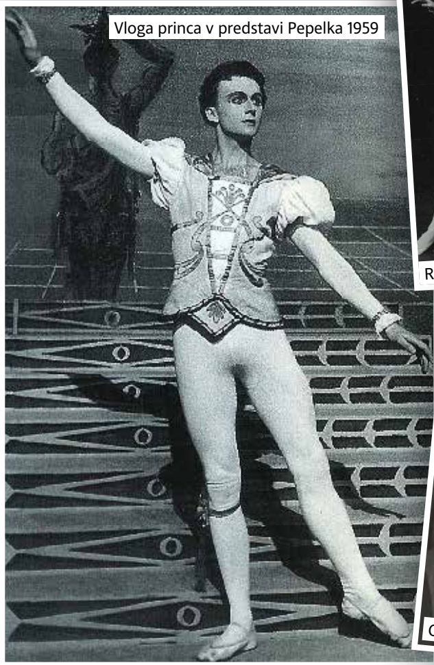
Vloga princa v predstavi Pepelka 1959